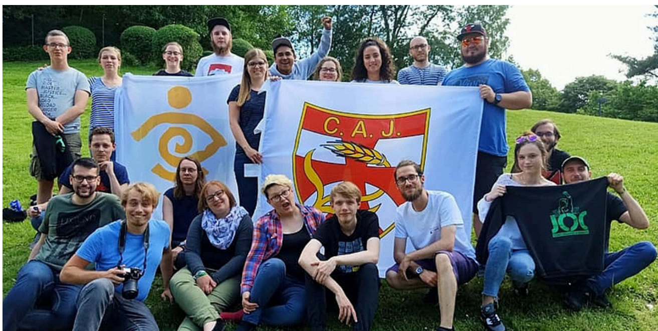
Seminarium "Realia życia i wyzwania, którym muszą sprostać dzisiaj młodzi Europejczycy", 13-17.06.2019 r

13.06.2019 - Rada do spraw Zatrudnienia, Polityki Socjalnej, Zdrowia i Spraw Konsumentów (EPSCO) przyjęła Konkluzje Rady Europejskiej dotyczące zmieniającego się świata pracy: refleksje na temat nowych form pracy. Dokument skupia się szczególnie na BHP